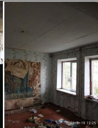
д. Дубовка, ул.Партизанская 1-ая, д.37, двухкомнатная, общая площадь 56,8 кв.м., жилая площадь 29,1 кв.м.